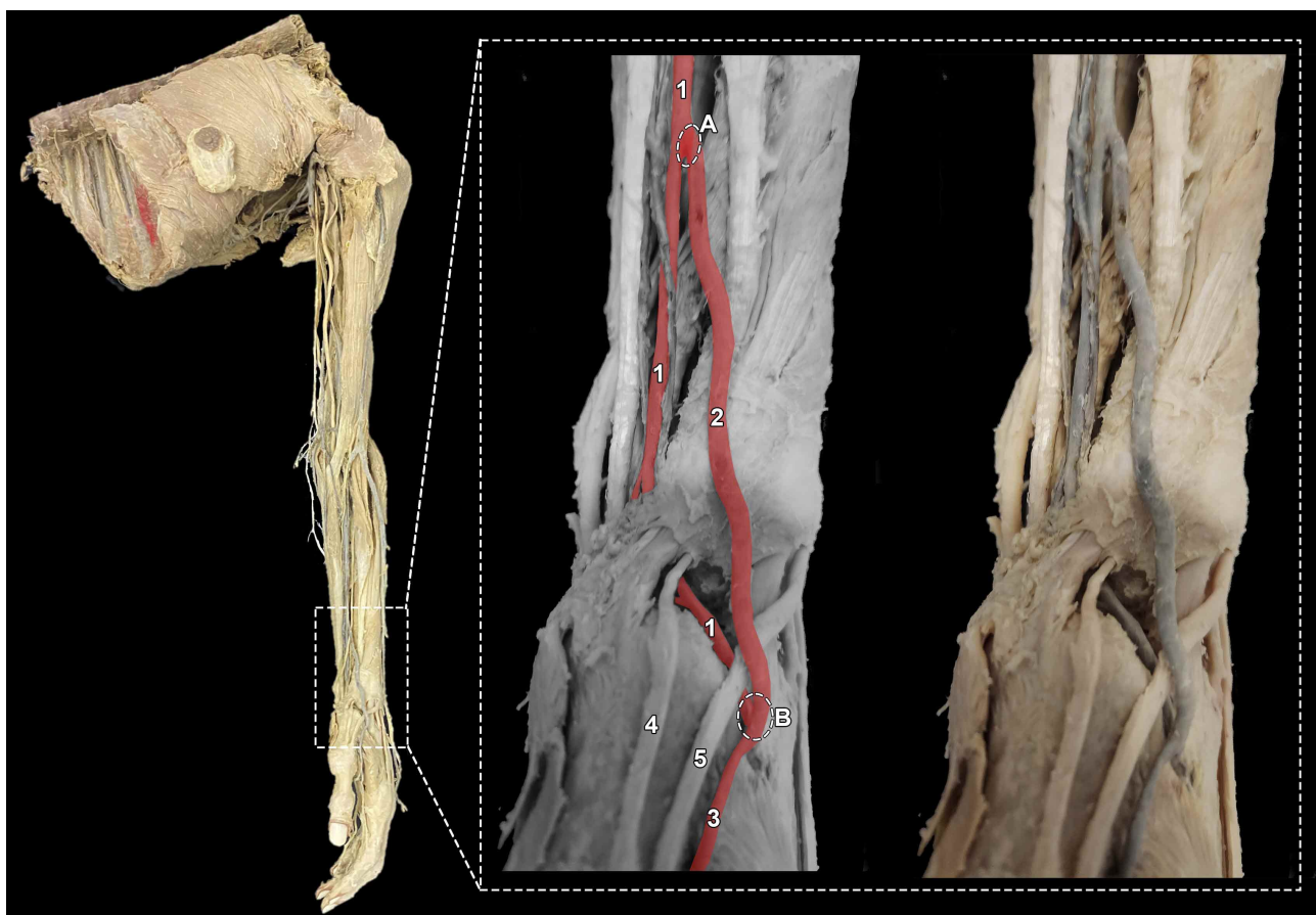
Fig. 2. Miembro superior izquierdo plastinado, destacándose en la ampliación, la rama colateral ( vas aberrans ) originada de la arteria radial, y que forma un puente vascular en la misma arteria, entre el tercio distal del antebrazo y la tabaquera anatómica. Este vas aberrans en su trayecto se dirige posteriormente, transcurriendo superficial al tendón del músculo extensor largo del pulgar, formándole una especie de pinza al mismo junto con la arteria radial que continúa su trayecto normal en el dorso de la mano. 1. Arteria radial; 2. vas aberrans ; 3. Primera arteria metacarpiana dorsal; 4. Tendón del músculo extensor corto del pulgar; 5. Tendón del músculo extensor largo del pulgar. A. Origen del vas aberrans desde la arteria radial. B. Anastomosis del vas aberrans con la arteria radial antes de que esta perfore el primer espacio interóseo y participe en la formación del arco palmar profundo.

En el miembro superior izquierdo, a nivel de la fosa cubital, la arteria braquial se dividió en las arterias ulnar y radial (Fig. 2). La arteria radial siguió un trayecto normal atravesando los tercios superior y medio del antebrazo en relación a la cara profunda del músculo braquiorradial, a nivel de cuyo tendón, en el tercio distal del antebrazo, se